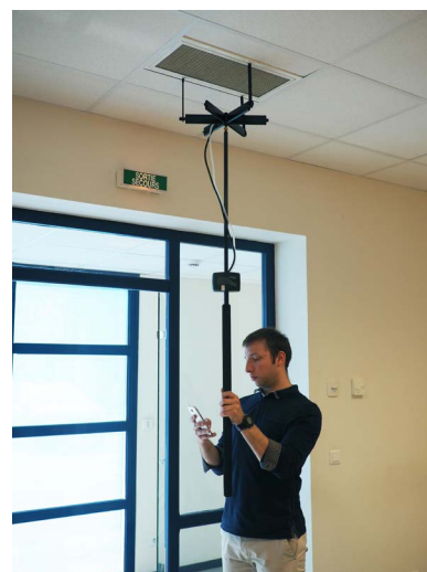
Utilisation avec la grille de mesure