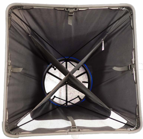
Hotte avec redresseur de flux