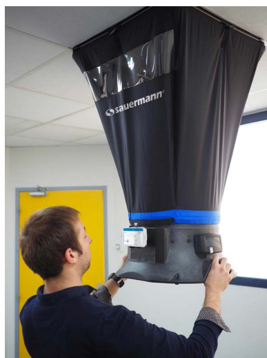
Mise en situation du débitmètre