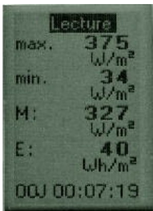
Les valeurs globales