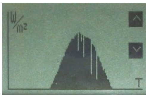
La représentation graphique 00H /24H