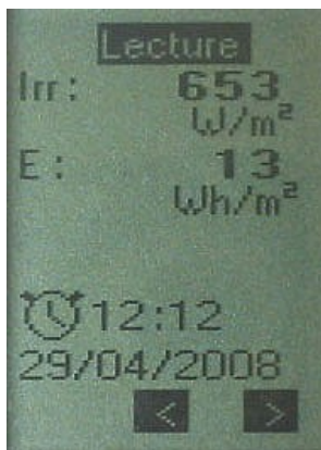
Valeurs stockées horodatées