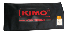
Sacoche de hotte

Chaque hotte est livrée dans sa sacoche de transport.