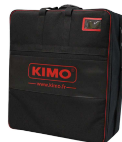
Valise de transport