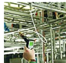
Contrôle d'un sécheur

Nous recommandons l'utilisation d'une chambre de mesure.