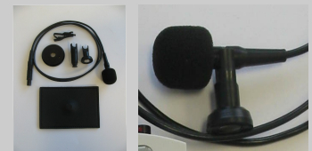
Kit de fixation